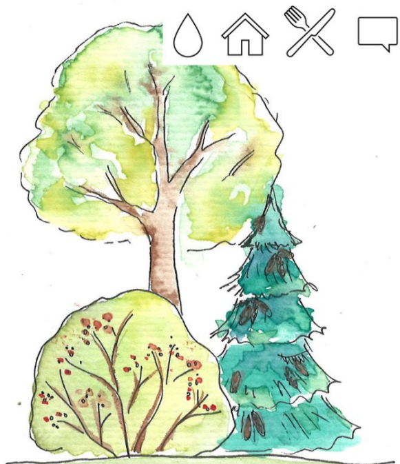
STROMY A KEŘE