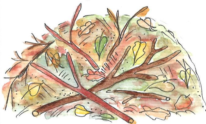
HROMADA VĚTVÍ A LISTÍ