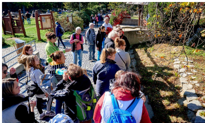
Den zvířat v letošním roce oslavíme v zoo v sobotu 5. října