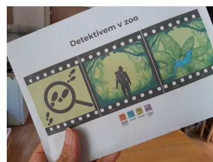
Spustili jsme Detektiva v zoo.