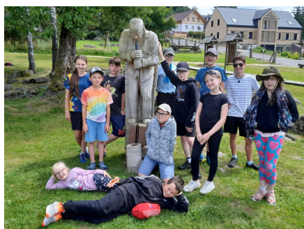
Připravili jsme a realizovali tábor.