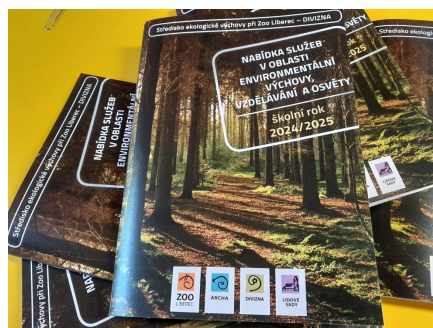
Vydali jsme novou nabídku.