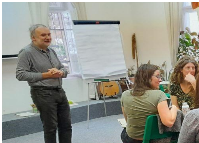
Autor příspěvku na semináři v SEV DIVIZNA Liberec.

Nový RVP podporuje ucelenou výuku o klimatu. Předpokládá, že na klimatickém vzdělávání bude spolupracovat více učitelů z různých oborů. Žáci by se měli učit o klimatické změně přemýšlet z různých stran a uvědomovat si, jak souvisí s jejich životem i životem společnosti. Měli by se učit rozpoznávat, které mediální zprávy o klimatu jsou vědecky podložené, které ne. Měli by dostat také prostor k tomu, aby mohli sdílet obavy i naděje, které z vývoje světa mají.