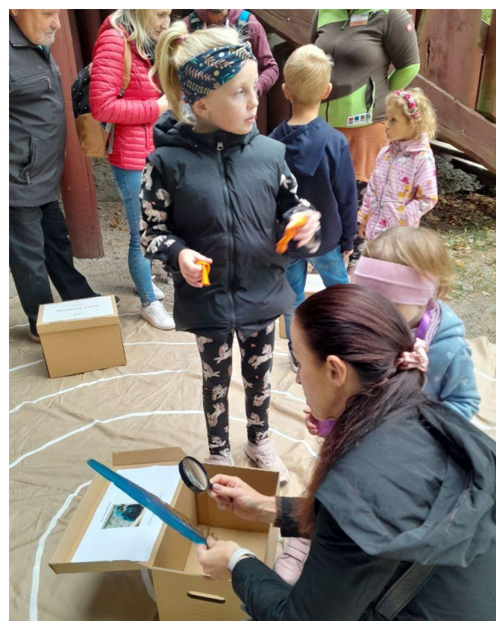
Návštěva u stánku DIVIZNY vždy stojí za to.

Kdo se rád bojí, si přijde na své na další tradiční říjnové akci. Populární Strašidelná zoo se letos odehraje o víkendu 26. a 27. října . Po oba tyto dny budou vždy ve večerních hodinách hlavním lákadlem zoo nikoliv zvířata, ale kouzelně nazdobená a nasvícená zahrada plná čarodějnic, umrlců, kostlivců či jinak děsivých bytostí. Pro ty zvláště otrlé bude opět připravena „hardcore zóna“.