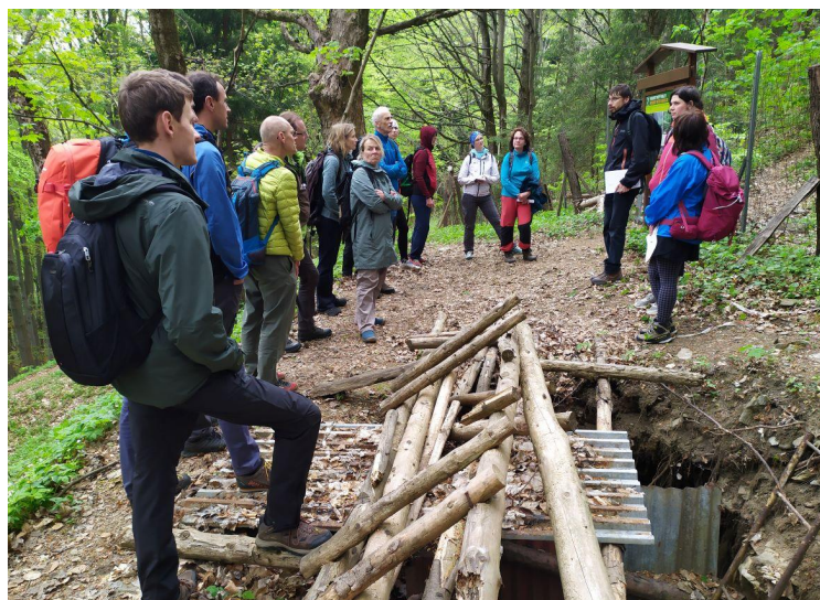
Podpora pedagogům patří mezi naše významné aktivity - fotografie z exkurze Proč Ještěd není sopka.

V novém návrhu RVP je i více prostoru věnováno „klimatickému vzdělávání“. Na to krásně navazuje metodický seminář „Jak na klima“ připravený na 1. 10. 2024 . Přinese spousty praktických ukázek, jak lze problematiku klimatické změny uchopit ve výuce. Je to aktuální téma, je to silný trend ve vzdělávání a my vám chceme s tímto tématem metodicky i fakticky pomoci.