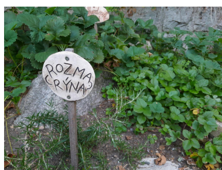
Pečovali jsme o naši zahrádku.