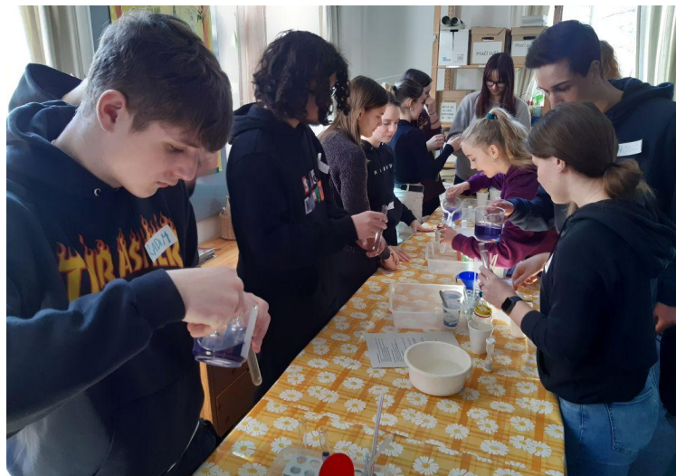
Badatelská výuka je nedílnou součástí našich programů.