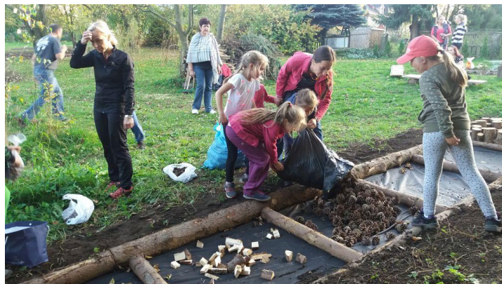
Do práce na zahradě se zapojili malí i velcí.

Kromě setkávání v zahradě organizujeme další akce pro rodiče s dětmi v okolí školy, namátkou jsou to například “Běžíme si pro jedničky”, “Drakiáda” nebo “Lampionový průvod”.