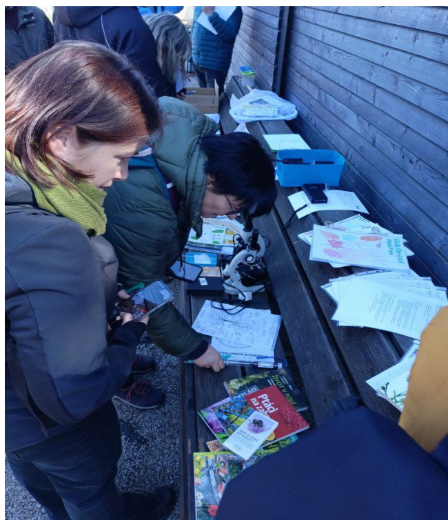
Zahrada se využívá celoročně, například i pro výuku budoucích koordinátorů EVVO.