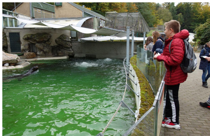
Změna klimatu se týká nejen lidí, ale i zvířat.