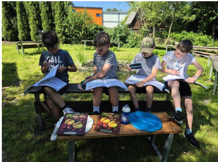
Děti z družiny tráví na zahradě spoustu času.