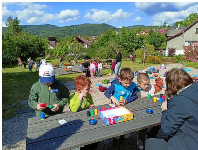
Seznámení budoucích prvňáčků se školou i zahradou.

Vypracovali jsme a realizujeme zde velké množství projektových dnů založených na principech badatelské výuky (např. vodní a hmyzí říše, půda, zahrada všemi smysly, geologie...). Do těchto projektových dnů zveme i odborníky. Na zahradě však probíhá i jiná výuka, např. pracovní činnosti, čtení, literární výchova, anglický jazyk, výtvarná výchova. Ve velké míře využívá zahradu k projektovým dnům i naše školní družina. Věřím, že do budoucna se počet předmětů, které budou zahradu pro výuku využívat, ještě rozšíří.